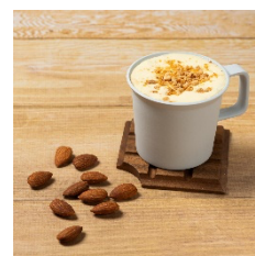
ジャンドゥーヤショコラ （写真はトッピング付）