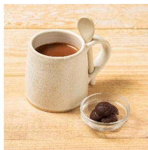
ビターチョコ×とろ〜りミルク